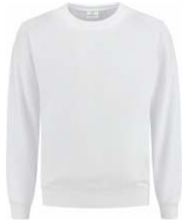
55 Wit . Weiß . White . Blanc