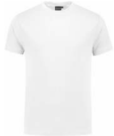
55 Wit . Weiß . White . Blanc