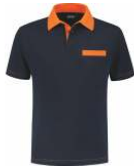
1040 Marine - Oranje Marine - Orange