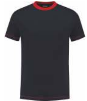
1020 Marine - Rood Marine - Rot Marine - Red Marine - Rouge