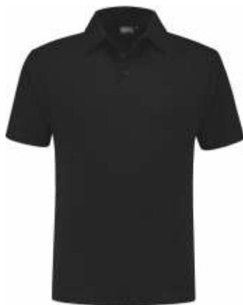
70 Zwart . Schwarz . Black . Noir