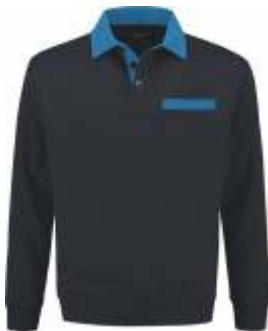
1060 Marine - Korenblauw Marine - Kornblumenblau Marine - Cornflower Blue Marine - Bleu Royal