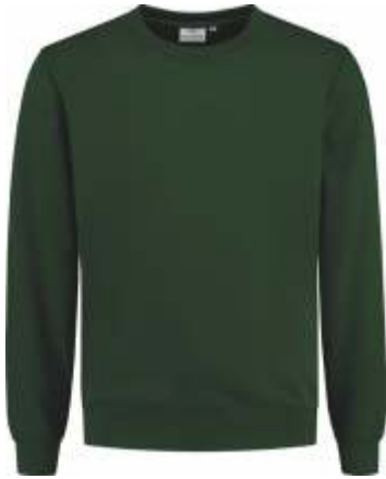
45 Groen . Grün . Green . Vert