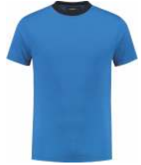
6010 Korenblauw - Marine Kornblumenblau - Marine Cornflower Blue - Marine Bleu Royal - Marine