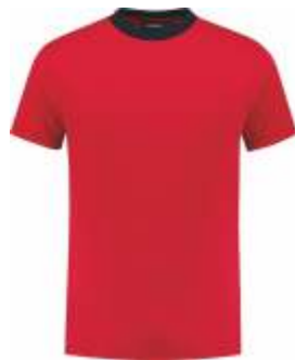
2010 Rood - Marine Rot - Marine Red - Marine Rouge - Marine