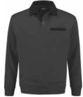
9070 Antraciet - Zwart Anthrazit - Schwarz Anthracite - Black Anthracite - Noir