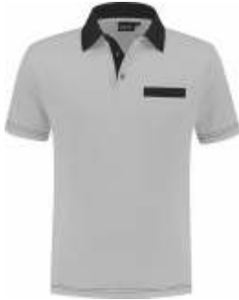
8070 Grijs - Zwart Grau - Schwarz Grey - Black Gris - Noir