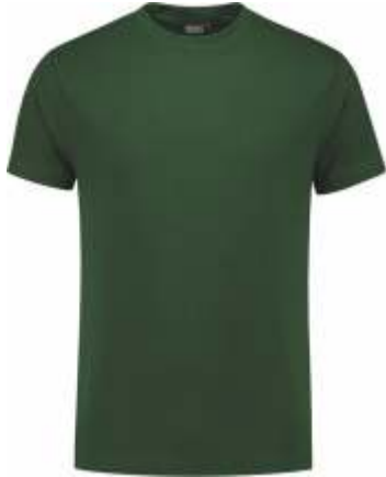
45 Groen . Grün . Green . Vert