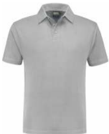
80 Grijs . Grau . Grey . Gris