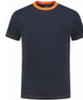
1040 Marine - Oranje Marine - Orange