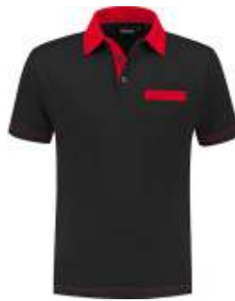
7020 Zwart - Rood Schwarz - Rot Black - Red Noir - Rouge