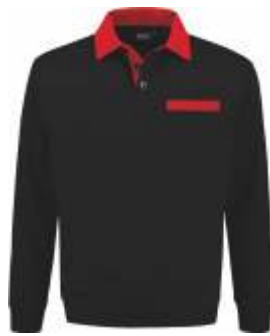
7020 Zwart - Rood Schwarz - Rot Black - Red Noir - Rouge