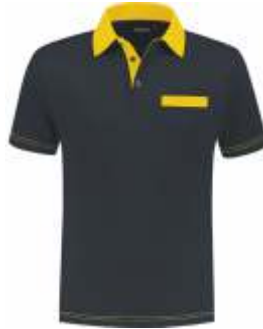
1030 Marine - Geel Marine - Gelb Marine - Yellow Marine - Jaune