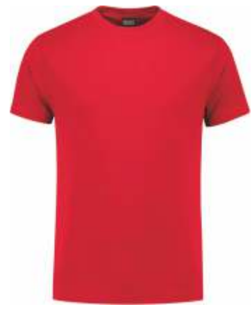
20 Rood . Rot . Red . Rouge