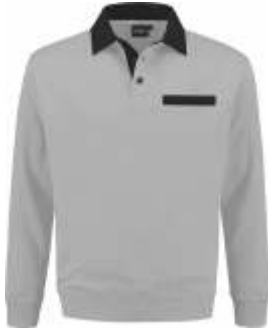
8070 Grijs - Zwart Grau - Schwarz Grey - Black Gris - Noir