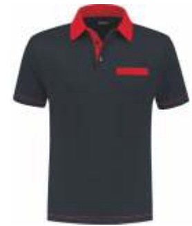
1020 Marine - Rood Marine - Rot Marine - Red Marine - Rouge