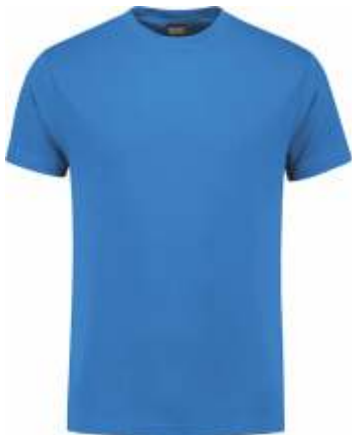
60 Korenblauw . Kornblumenblau . Cornflower Blue . Bleu Royal