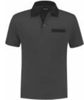
9070 Antraciet - Zwart Anthrazit - Schwarz Anthracite - Black Anthracite - Noir