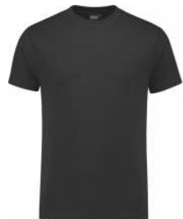
90 Antraciet . Anthrazit . Anthracite