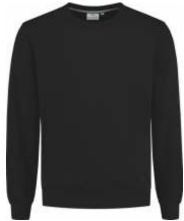
70 Zwart . Schwarz . Black . Noir