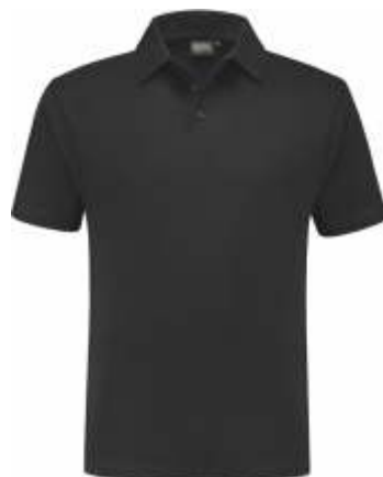
90 Antraciet . Anthrazit . Anthracite