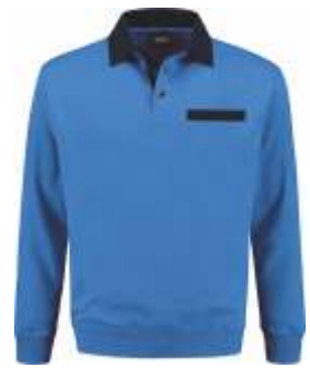
6010 Korenblauw - Marine Kornblumenblau - Marine Cornflower Blue - Marine Bleu Royal - Marine