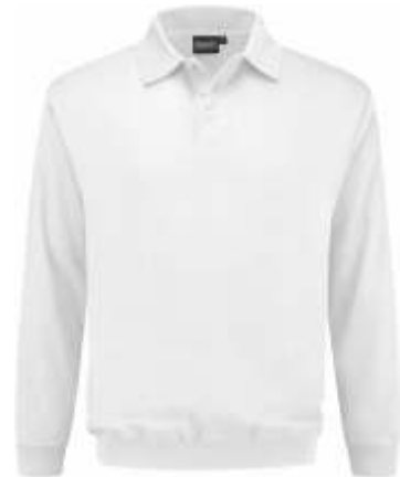
55 Wit . Weiß . White . Blanc