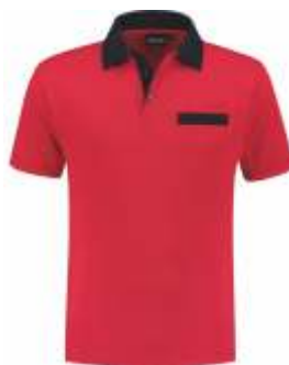
2010 Rood - Marine Rot - Marine Red - Marine Rouge - Marine