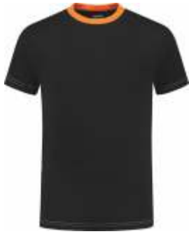
7040 Zwart - Oranje Schwarz - Orange Black - Orange Noir - Orange