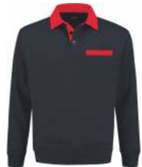
1020 Marine - Rood Marine - Rot Marine - Red Marine - Rouge