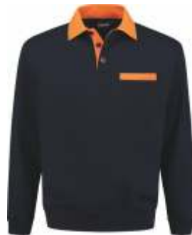
1040 Marine - Oranje Marine - Orange