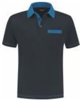
1060 Marine - Korenblauw Marine - Kornblumenblau Marine - Cornflower Blue Marine - Bleu Royal