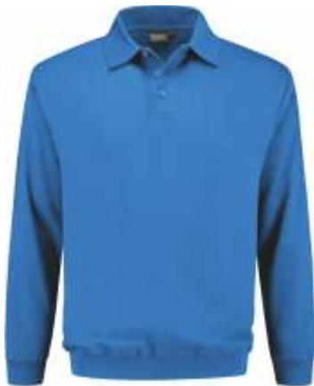
60 Korenblauw . Kornblumenblau . Cornflower Blue . Bleu Royal