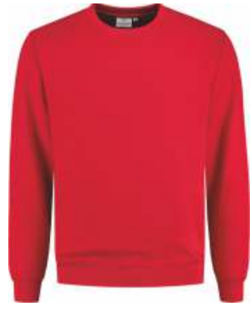
20 Rood . Rot . Red . Rouge