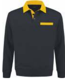
1030 Marine - Geel Marine - Gelb Marine - Yellow Marine - Jaune