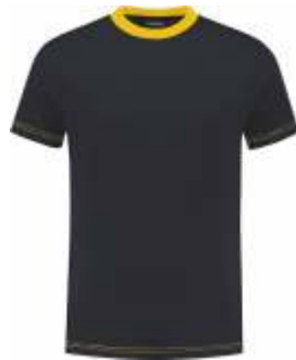
1030 Marine - Geel Marine - Gelb Marine - Black Marine - Jaune