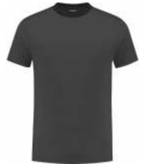
9070 Antraciet - Zwart Anthrazit - Schwarz Anthracite - Black Anthracite - Noir