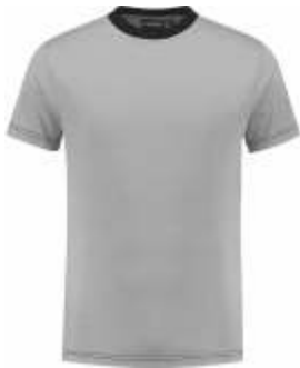
8070 Grijs - Zwart Grau - Schwarz Grey - Black Gris - Noir