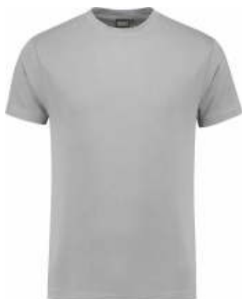
80 Grijs . Grau . Grey . Gris