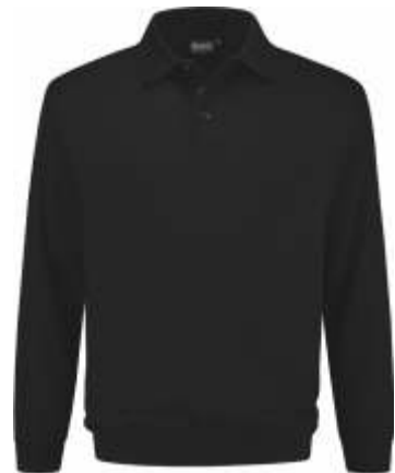
70 Zwart . Schwarz . Black . Noir