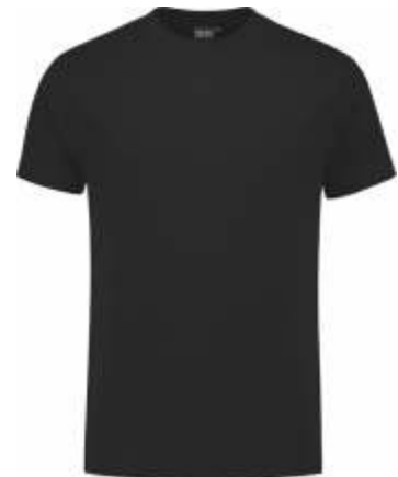
70 Zwart . Schwarz . Black . Noir