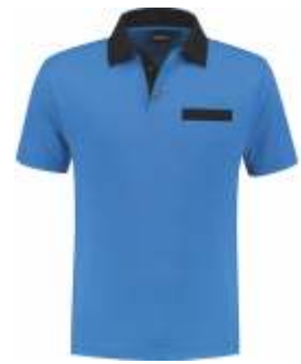
6010 Korenblauw - Marine Kornblumenblau - Marine Cornflower Blue - Marine Bleu Royal - Marine