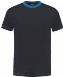
1060 Marine - Korenblauw Marine - Kornblumenblau Marine - Cornflower Blue Marine - Bleu Royal