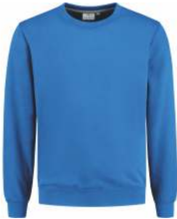
60 Korenblauw . Kornblumenblau . Cornflower Blue . Bleu Royal