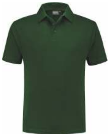
45 Groen . Grün . Green . Vert