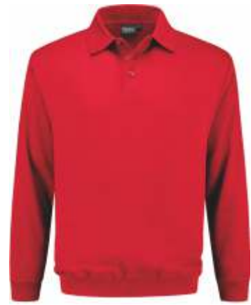
20 Rood . Rot . Red . Rouge