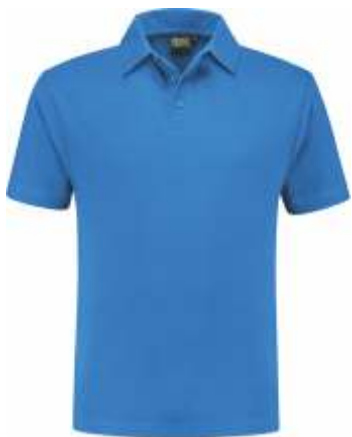
60 Korenblauw . Kornblumenblau . Cornflower Blue . Bleu Royal