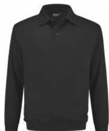
90 Antraciet . Anthrazit . Anthracite