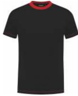
7020 Zwart - Rood Schwarz - Rot Black - Red Noir - Rouge