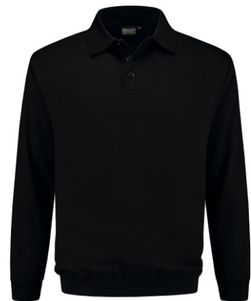
70 Zwart . Schwarz . Black . Noir