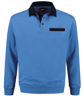
6010 Korenblauw - Marine Kornblumenblau - Marine Cornflower Blue - Marine Bleu Royal - Marine