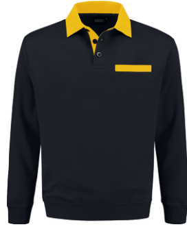
1030 Marine - Geel Marine - Gelb Marine - Yellow Marine - Jaune