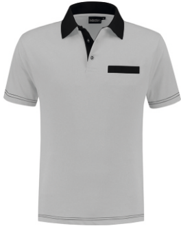
8070 Grijs - Zwart Grau - Schwarz Grey - Black Gris - Noir