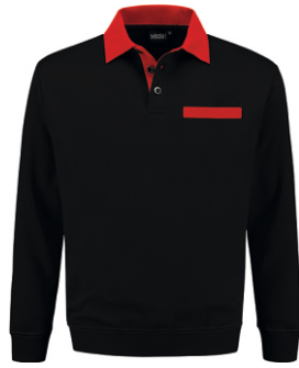
7020 Zwart - Rood Schwarz - Rot Black - Red Noir - Rouge