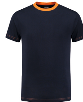
1040 Marine - Oranje Marine - Orange