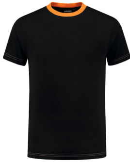
7040 Zwart - Oranje Schwarz - Orange Black - Orange Noir - Orange