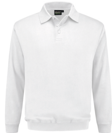
55 Wit . Weiß . White . Blanc