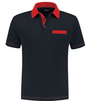
1020 Marine - Rood Marine - Rot Marine - Red Marine - Rouge