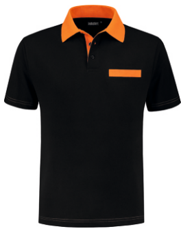
7040 Zwart - Oranje Schwarz - Orange Black - Orange Noir - Orange