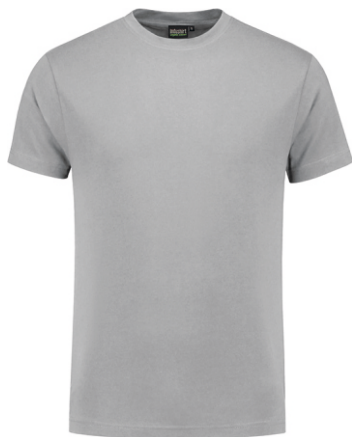
80 Grijs . Grau . Grey . Gris