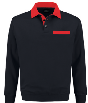
1020 Marine - Rood Marine - Rot Marine - Red Marine - Rouge