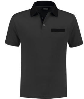
9070 Antraciet - Zwart Anthrazit - Schwarz Anthracite - Black Anthracite - Noir