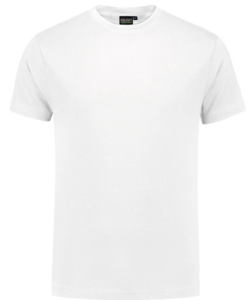
55 Wit . Weiß . White . Blanc