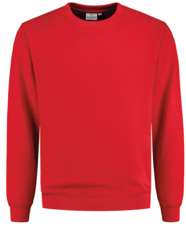
20 Rood . Rot . Red . Rouge