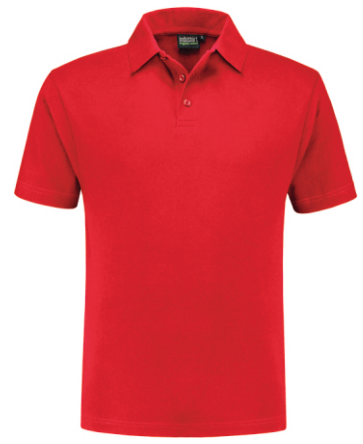
20 Rood . Rot . Red . Rouge