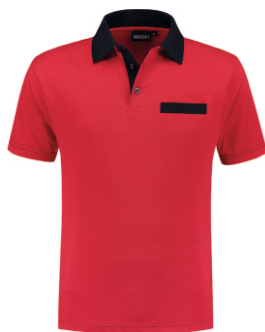
2010 Rood - Marine Rot - Marine Red - Marine Rouge - Marine