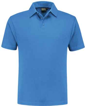
60 Korenblauw . Kornblumenblau . Cornflower Blue . Bleu Royal