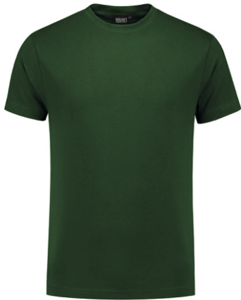
45 Groen . Grün . Green . Vert