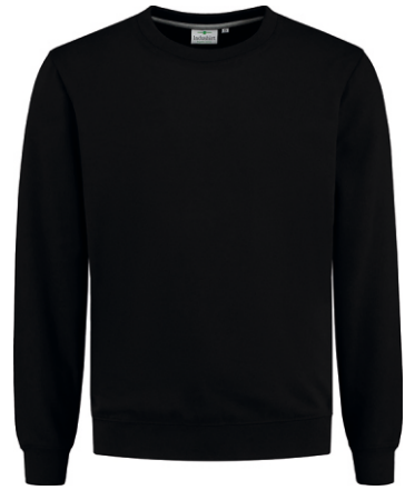
70 Zwart . Schwarz . Black . Noir