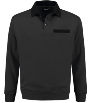
9070 Antraciet - Zwart Anthrazit - Schwarz Anthracite - Black Anthracite - Noir