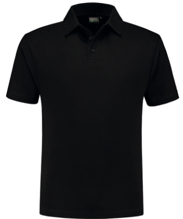
70 Zwart . Schwarz . Black . Noir