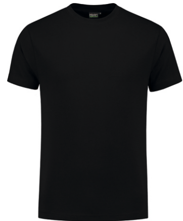
70 Zwart . Schwarz . Black . Noir