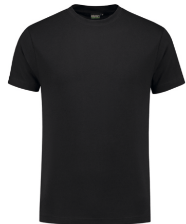
90 Antraciet . Anthrazit . Anthracite