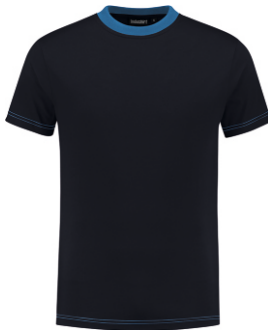
1060 Marine - Korenblauw Marine - Kornblumenblau Marine - Cornflower Blue Marine - Bleu Royal