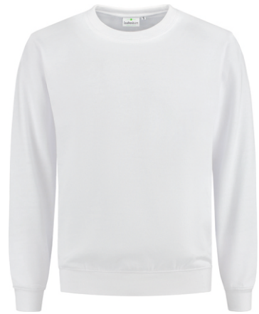
55 Wit . Weiß . White . Blanc