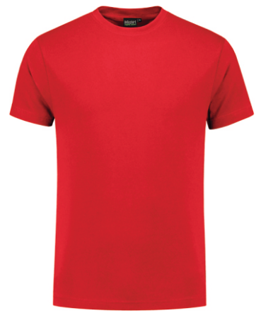
20 Rood . Rot . Red . Rouge