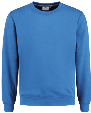
60 Korenblauw . Kornblumenblau . Cornflower Blue . Bleu Royal