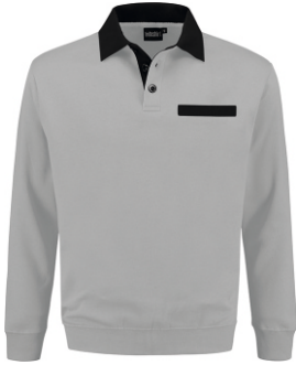
8070 Grijs - Zwart Grau - Schwarz Grey - Black Gris - Noir