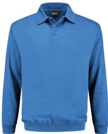
60 Korenblauw . Kornblumenblau . Cornflower Blue . Bleu Royal