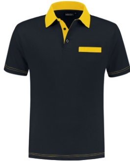
1030 Marine - Geel Marine - Gelb Marine - Yellow Marine - Jaune