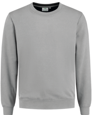
80 Grijs . Grau . Grey . Gris