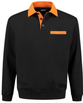
7040 Zwart - Oranje Schwarz - Orange Black - Orange Noir - Orange