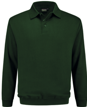
45 Groen . Grün . Green . Vert