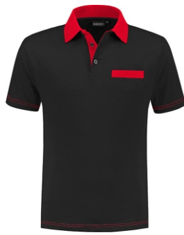
7020 Zwart - Rood Schwarz - Rot Black - Red Noir - Rouge