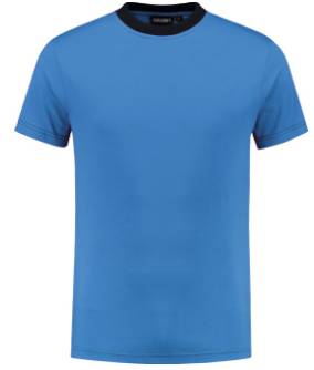
6010 Korenblauw - Marine Kornblumenblau - Marine Cornflower Blue - Marine Bleu Royal - Marine