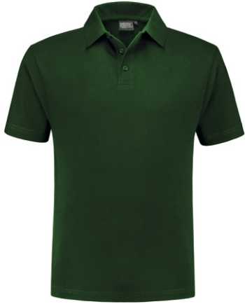
45 Groen . Grün . Green . Vert