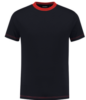
1020 Marine - Rood Marine - Rot Marine - Red Marine - Rouge