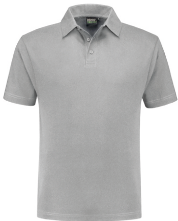
80 Grijs . Grau . Grey . Gris