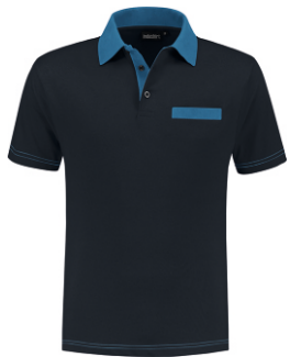
1060 Marine - Korenblauw Marine - Kornblumenblau Marine - Cornflower Blue Marine - Bleu Royal