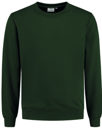
45 Groen . Grün . Green . Vert