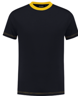
1030 Marine - Geel Marine - Gelb Marine - Black Marine - Jaune