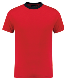
2010 Rood - Marine Rot - Marine Red - Marine Rouge - Marine