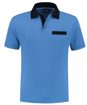
6010 Korenblauw - Marine Kornblumenblau - Marine Cornflower Blue - Marine Bleu Royal - Marine