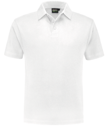
55 Wit . Weiß . White . Blanc