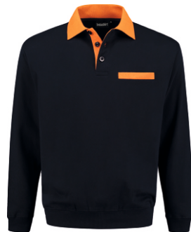
1040 Marine - Oranje Marine - Orange