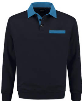
1060 Marine - Korenblauw Marine - Kornblumenblau Marine - Cornflower Blue Marine - Bleu Royal