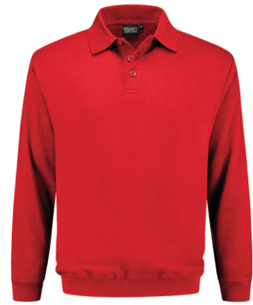
20 Rood . Rot . Red . Rouge