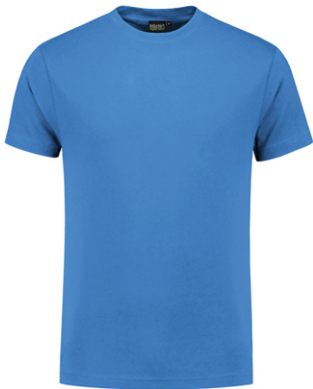
60 Korenblauw . Kornblumenblau . Cornflower Blue . Bleu Royal