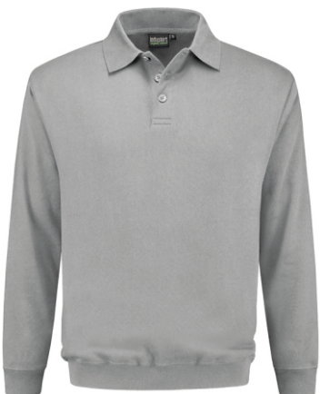
80 Grijs . Grau . Grey . Gris