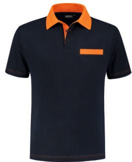
1040 Marine - Oranje Marine - Orange