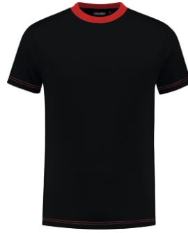
7020 Zwart - Rood Schwarz - Rot Black - Red Noir - Rouge